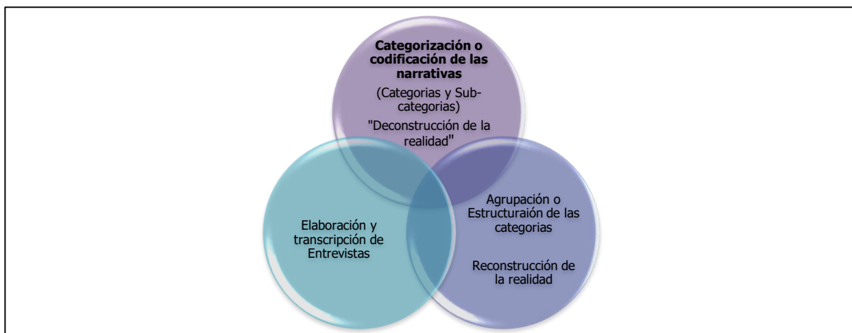
Figura No. 1. Análisis Textual.

Este procedimiento implicó, según Morales (2015), la "deconstrucción" de la realidad investigada mediante la segmentación de las narrativas en categorías y subcategorías de análisis, para posteriormente "reconstruirla" de manera organizada a través de la agrupación y estructuración de dichas unidades de sentido, en función de dar respuesta al objetivo del estudio (ver Figura 1).